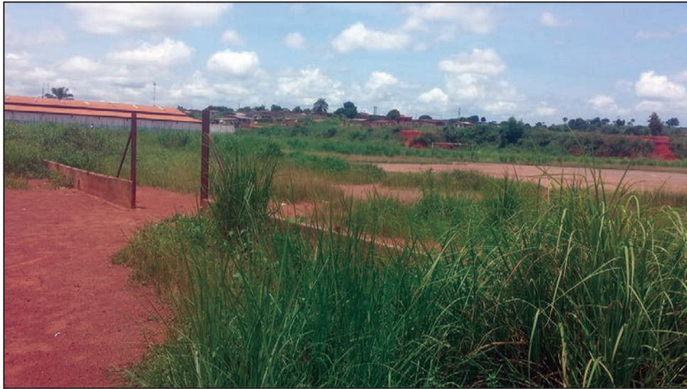
Le Stade Mangandzi abandonné dans l'herbe

Aux abords du Stade Mangandzi, on peut à peine reconnaître la présence des moniteurs d'auto-écoles qui y viennent pour des cours pratiques de conduite. Selon nos sources, le bureau de la Ligue départementale de football du Niari aurait sollicité par voie épistolaire le concours du maire de la ville de Dolisie afin que ce dernier mette un engin de la municipalité à leur service pour débayer ce stade. Depuis lors, affirment ces mêmes sources, aucune réaction de l'autorité. De plus en plus, les herbes gagnent en hauteur et en épaisseur dans ce stade. On éprouvera beaucoup de difficultés à suivre le ballon et les pieds des joueurs poussant le ballon. La salle couverte