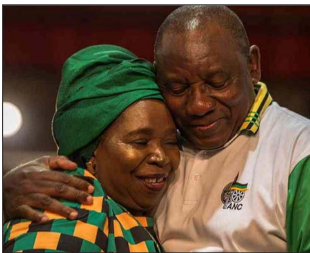
Nkosazana Dlamini-Zuma congratulée par Cyril Ramaphosa

Dans cette nouvelle équipe gouvernementale figurent entre autres: David Mabuza, 57 ans, vice-président, surnommé le «chat» pour ses qualités d'habile tacticien, il traîne derrière lui une réputation sulfureuse de jusqu'au-boutiste prêt à tout, y compris à l'intimidation et à la violence, pour asseoir son autorité. Certains l'accusent