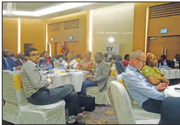
Vue partielle des comptables pendant la formation

ment pour objectifs de rappeler les principaux changements apportés par le SYSCOHADA révisé; de permettre aux participants d'identifier les principaux retraitements extracomptables à opérer conformément à la réglementation fiscale en vigueur; d'anticiper les éventuelles incidences fiscales de la réforme comptable et de discuter des mesures de sauvegarde; d'identifier les principales sources de risque fiscal et d'établir une cartographie des risques fiscaux de l'entreprise, tout comme de minimiser les risques d'erreurs fiscales et de mettre en place un système de management efficace. La loi de finance 2018 ne comporte pas des mesures majeures susceptibles d'impacter efficacement. Par contre le SYSCOHADA révisé, applicable dans 17 pays franco-