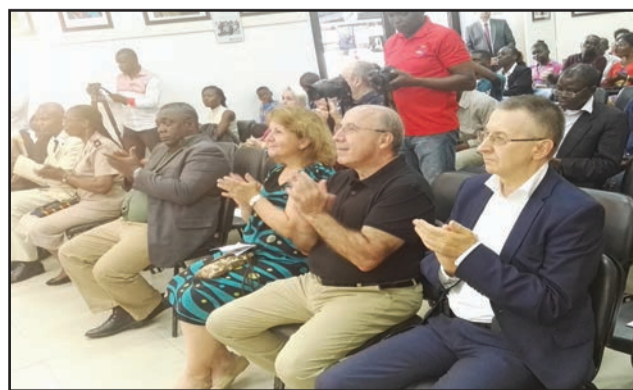
Une vue des spectateurs. Au premier plan, à droite, l'ambassadeur de Russie