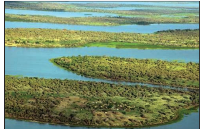
Le Lac Tchad menacé de sécheresse

La capitale du Nigéria, Abuja, a abrité du 26 au 28 février 2018 une conférence internationale sur la protection du Lac Tchad, sous l'égide d'Engr Sanusi Imran Abdullahi, secrétaire de la Commission du bassin du lac Tchad (CBLT). Initiée par l'UNESCO en partenariat avec cette commission, la rencontre a connu la participation des responsables politiques, des scientifiques et des représentants des commissions locales du bassin du Lac Tchad.