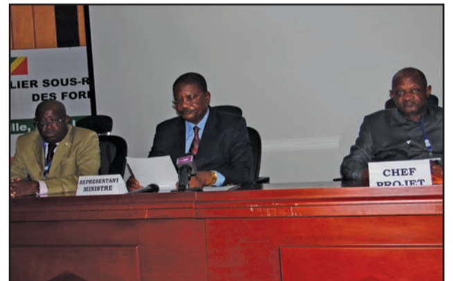
Le presidium à la clôture des travaux

sion en 2012, le besoin de procéder à une deuxième révision permettra de mieux répondre aux attentes des Etats, notamment en lien avec leurs engagements pris dans diverses conventions. «Cette révision a permis d'optimiser le suivi des thématiques émergentes, et d'harmoniser les indicateurs en s'alignant sur les processus globaux et les objectifs de développement durable. Il s'est agi d'aborder les étapes relatives à la coordination et à la publication des prochains Etats des forêts et des aires protégées», a-t-il dit. Le directeur général de l'Economie forestière, représentant la