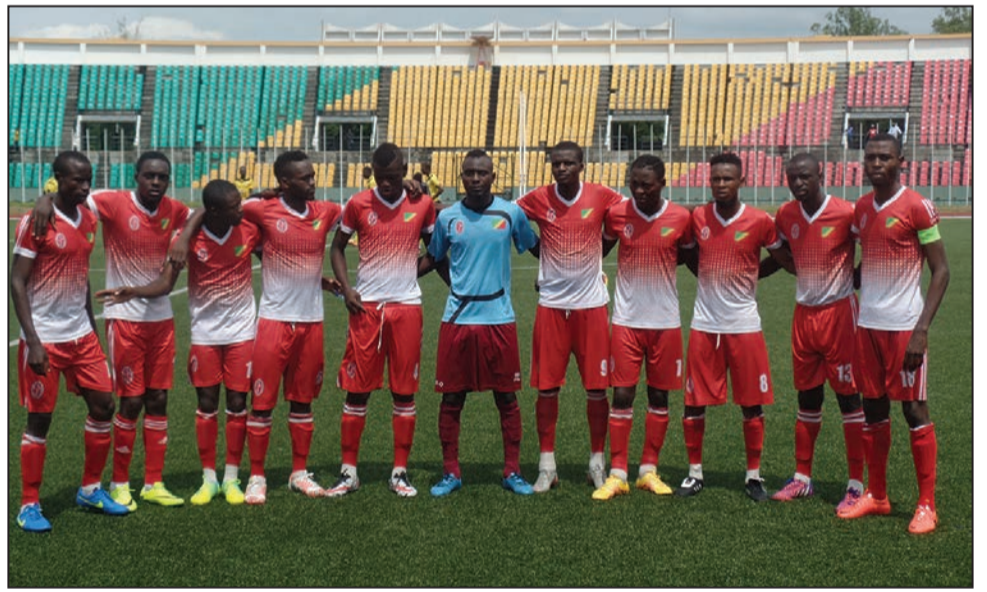
Saint-Michel de Ouenzé, lanterne rouge

Saint-Michel de Ouenzé (SMO) et Inter Club sont inquiets pour leur avenir en ligue 1. Et leurs dirigeants le disent haut. Parce que tourmentés par le doute. Chaque journée de championnat qui passe les plonge dans un océan de pessimisme et les éloigne du but.