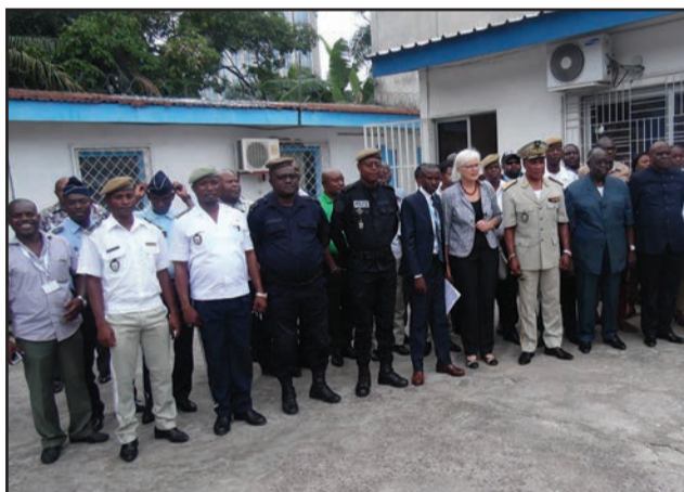
Les participants et les officiels

aider pour faire mieux plutôt qu'à condamner. La Force publique joue un rôle clé dans un état de droit. Elle a comme rôle de garantir l'état de droit contre ceux qui voudraient lui nuire. A ce titre, la Force publique dispose d'un monopole de la violence. Mais celui-ci ne constitue pas une carte blanche pour de la violence arbitraire. Le fonctionnement de la Force publique est régi