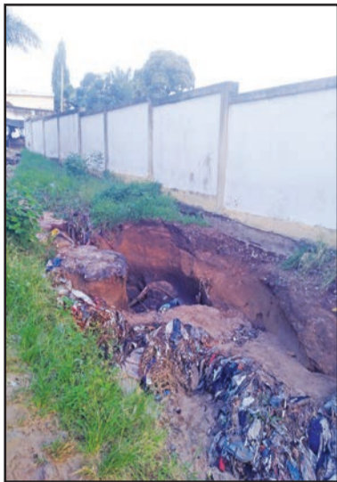
Une pointe d'érosion

Les parades de fortune font recours à tout ce qui est susceptible de résister aux furies des eaux de ruissellement. Celles-ci ont la fâcheuse tendance de suivre le tracé des rues, de longer les murs d'enceinte et de fracasser tous les obstacles sur leur passage, bétons ou arbres. Les quartiers en pente sont les plus particulièrement exposés, mais les eaux de pluie ont tendance à se créer leur propre puissance aussi en terrain plat et dans les vallées. Car, du fait de s'accumuler en un endroit entonnoir, elles