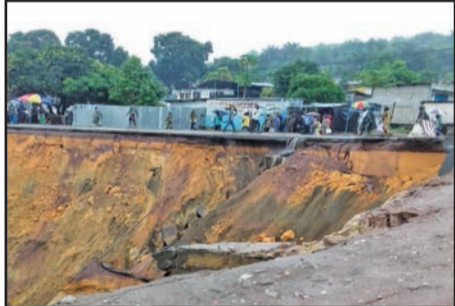
La deuxième sortie nord coupée en deux

La pluie qui s'est abattue dans la nuit du dimanche 18 au lundi 19 février dernier a englouti une partie de la voie goudronnée de la route de Ngamakosso, dans le 6 e arrondissement de la Ville-capitale. Les populations de cette zone vivent un calvaire pour se déplacer. Une délégation du ministère de l'Aménagement est allée constater les dégâts le 20 février.