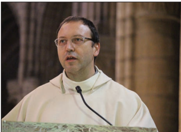
Père Gambalunga (P.12)

«La préparation de la Positio , dont je suis responsable, avance à un bon rythme»