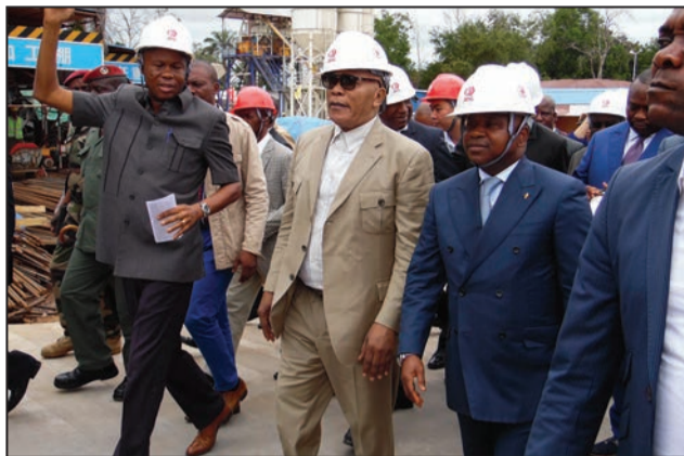
Les présidents des deux chambres pendant la visite

A signaler que cet ouvrage est le plus grand projet chinois au Congo en juger par le montant, financé entièrement par l'Etat chinois, depuis l'établissement des relations diplomatiques entre la Chine et le Congo. Ce projet se réalise sur un