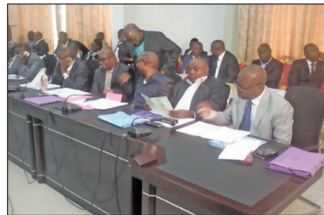
...pendant le conseil d'administration

Et pour trouver des solutions aux problèmes financiers que connaît la mutuelle, dus à la baisse de l'activité économique, il a été mise en place une commission de réflexion sur la gestion des mess construits dans tous les départements, grâce à la