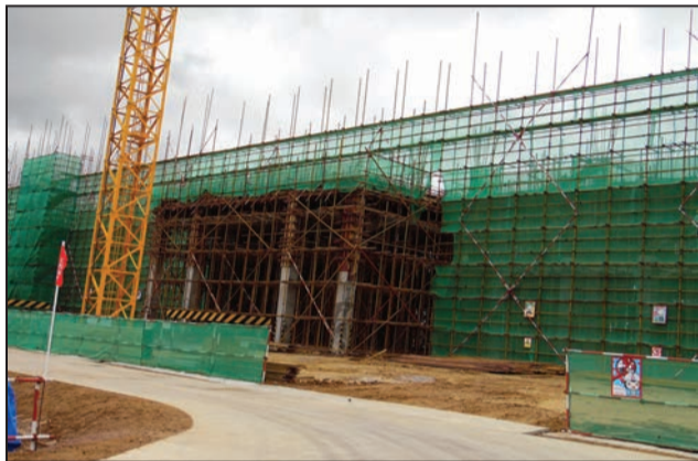
Le siège du parlement en construction

site dont la forme triangulaire est délimitée par le Boulevard Denis Sassou-Nguesso, le surface bâtie de 24.408 mètres carrés. Les bâtiments du siège, quant