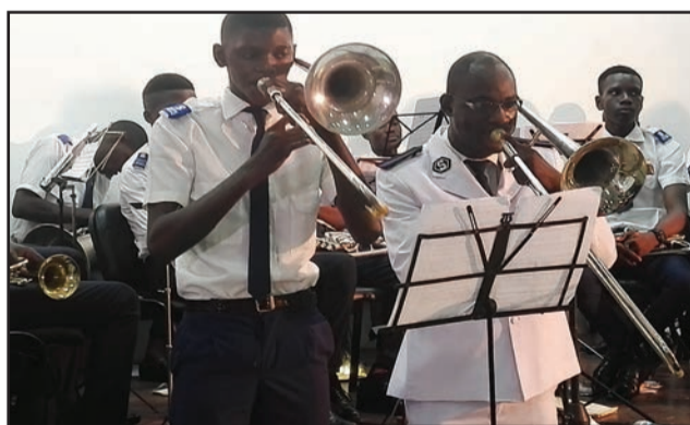
Pendant le concert