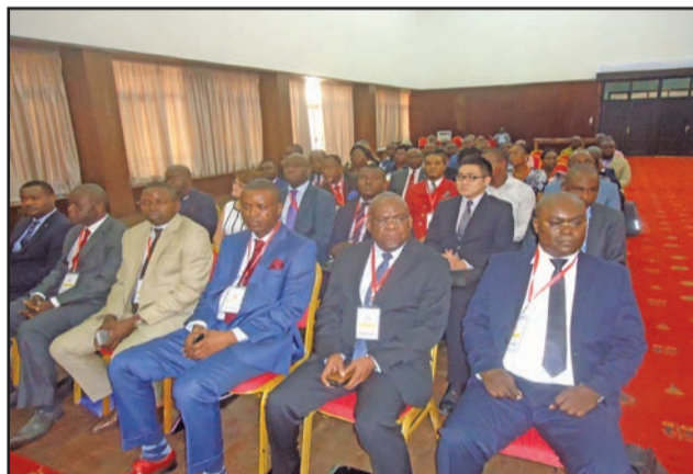
Des agents techniques du CNC à la clôture

mutation de la comptabilité générale vers la comptabilité financière. Elle consacre également l'uniformisation des espaces francophone et anglo-saxon dans le domaine de la comptabilité. «Ce qui est une avancée vers la constitution du village planétaire dans la vie des entreprises», a déclaré Jean-Baptiste Ondaye, secrétaire général de la Présidence, à l'ouverture, avant de préciser à la clôture que «les changements apportés par ce nouveau référentiel s'inscrivent dans l'intérêt de l'amélioration de nos comportements à tous les niveaux dans la gestion des affaires publiques.» Animé principalement par M. Mor Niang, formateur certifié aux normes IFRS, ce séminaire a apporté une valeur ajoutée à l'habileté des agents du CNC. Ces derniers, nantis du nouveau